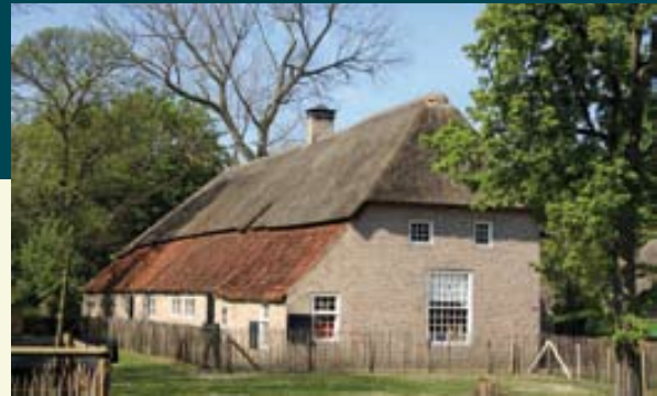
De langgevelboerderij wordt vaak gezien als het eindpunt in de ontwikkeling van de Nederlandse boerderij.

dit type boerderijen. Horizontale latten, bevestigd aan de sporen, ondersteunden de uiteindelijke dakbedekking. Als dakbedekking werd vaak riet en soms het goedkopere roggestro gebruikt. Later zien we dikwijls daken waarvan het onderste deel van het dakvlak met pannen is gedekt. Nadat het dak gereed was, werden tot slot de wanden aangebracht. Deze bestonden uit een raamwerk ('vakwerk') van horizontale en verticale latten, waartussen het vlechtwerk ('vitselwerk') van wilgentenen werd aangebracht, aan weerszijden bestreken met een mengsel van leem, fijngehakt stro en soms ook koemest.